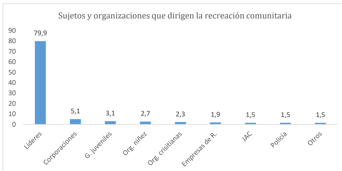
Gráfico 2. Sujetos y organizaciones que dirigen la recreación comunitaria.